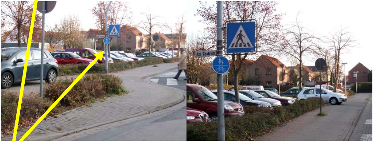
Hier links, ganz klein, hängt das entscheidende Schild!